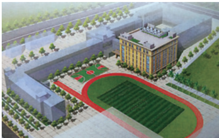
▲學珠樓的原設計圖