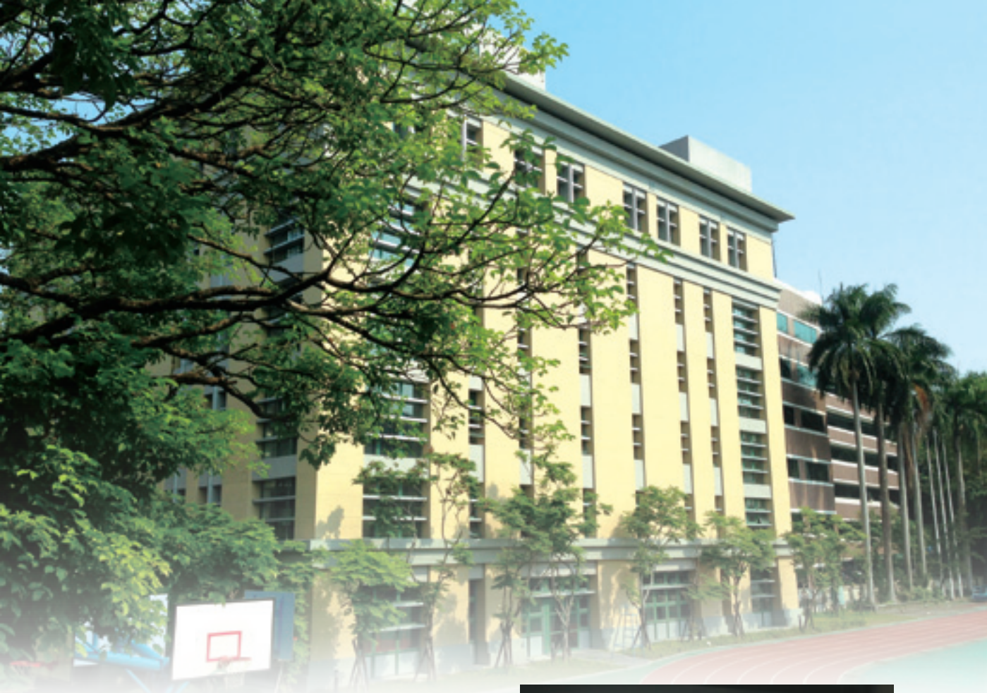
▲土建完成的學珠樓