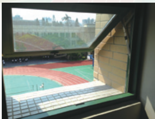
▲學珠樓正常開啟的窗子

自民國91年12月起至104年2月，學珠樓的捐款已達54,907,451元（徵信於本校網站的首頁）。回顧北一女在建校100年校慶時，前校長陳富貴有感於北一女教學資源極待充實，立定改建